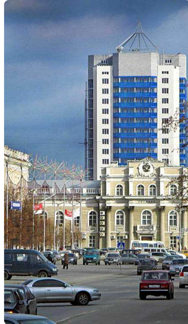
Курганская область 70