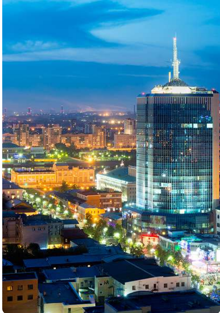
Челябинская область 100