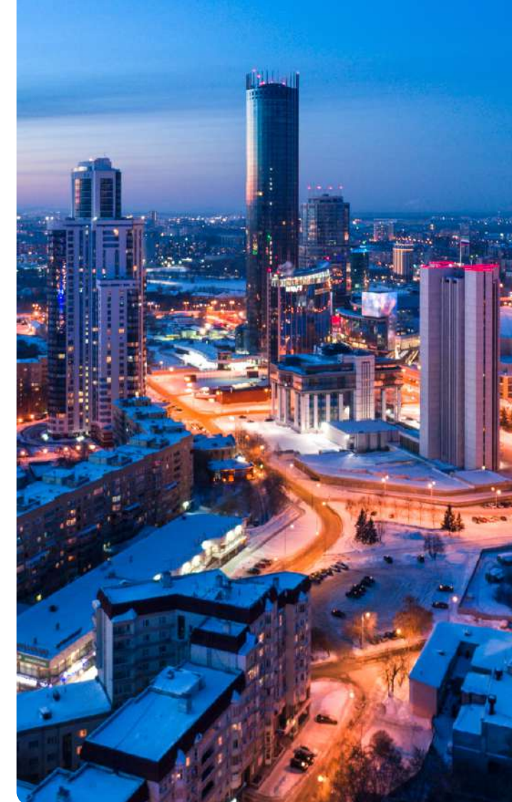
Свердловская область 70