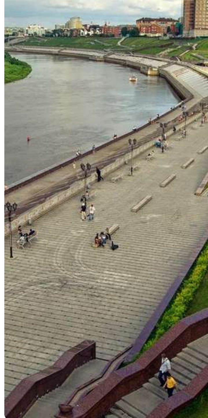
Тюменская область 70